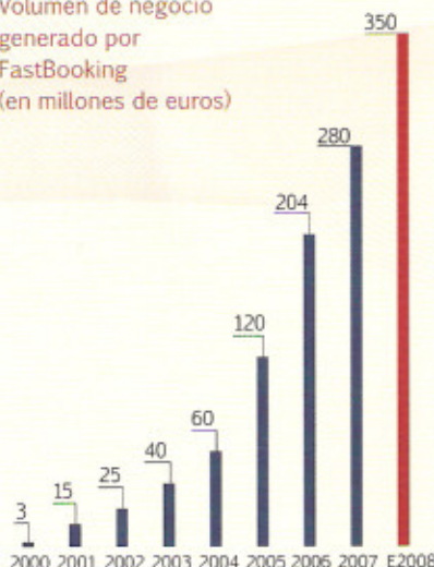
Volumen de negocio generado por FastBooking (en millones de euros)

FastBooking permite también optimizar su actividad comercial gracias a la distribución en los canales GDS/IDS, que constituyen un servicio muy rentable.